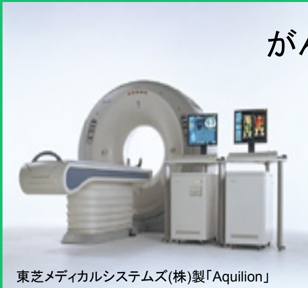
東芝メディカルシステムズ(株)製「Aquilion」